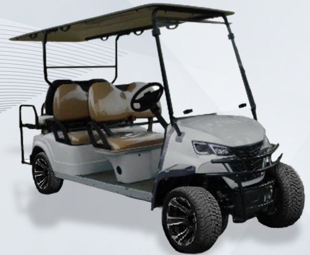
6 pax: EG204EKSZ