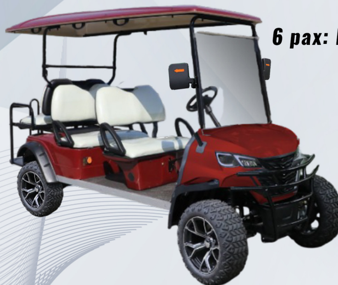
6 pax: EG204DKSZ