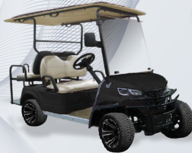
4 pax: EG202EKSZ