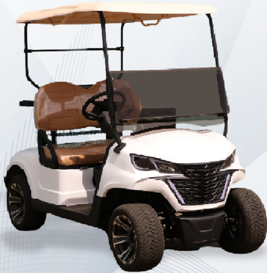
2 pax: EG202EK