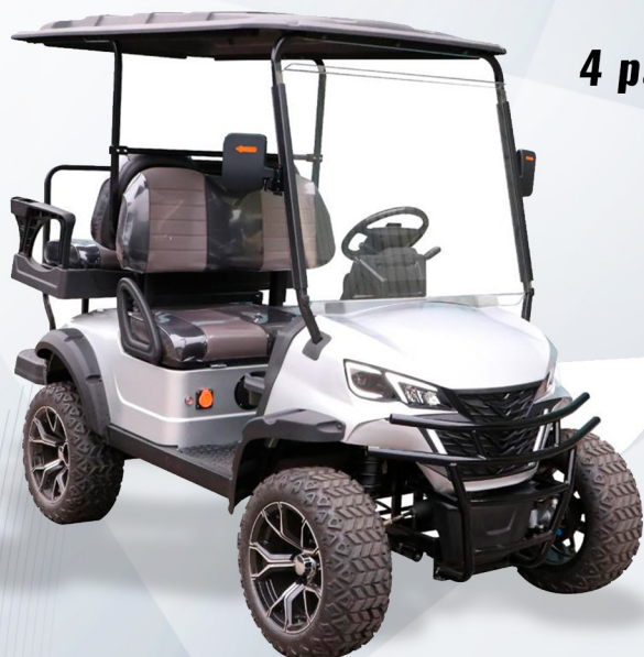
4 pax: EG202DKSZ